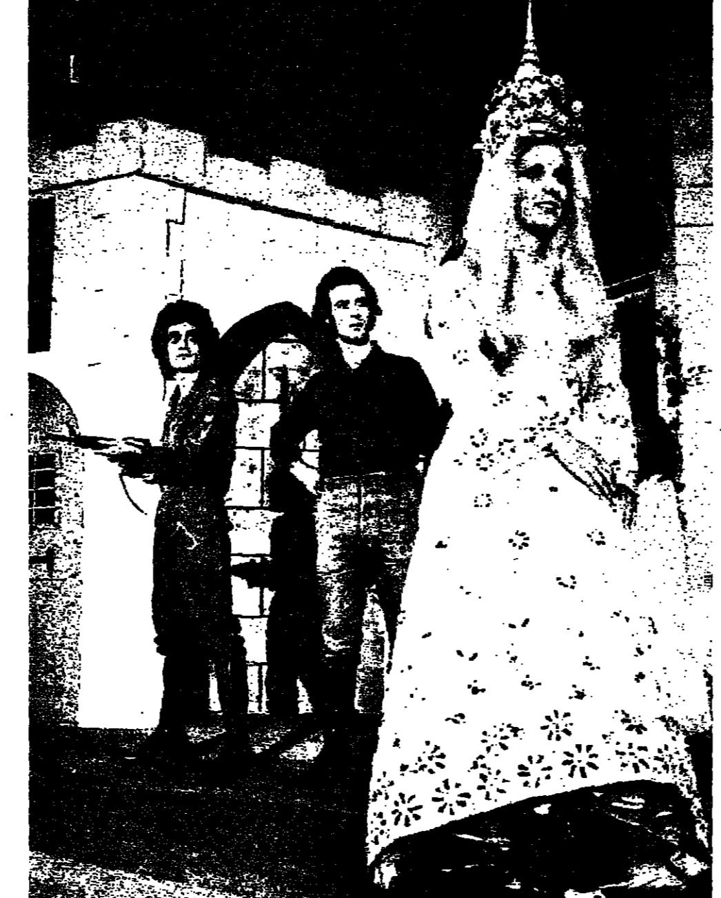
مشهد من «الطوي كثير»